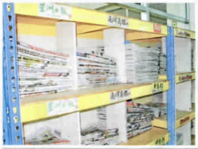
◆圖書館備有3種語文的舊報紙，供查詢資料。