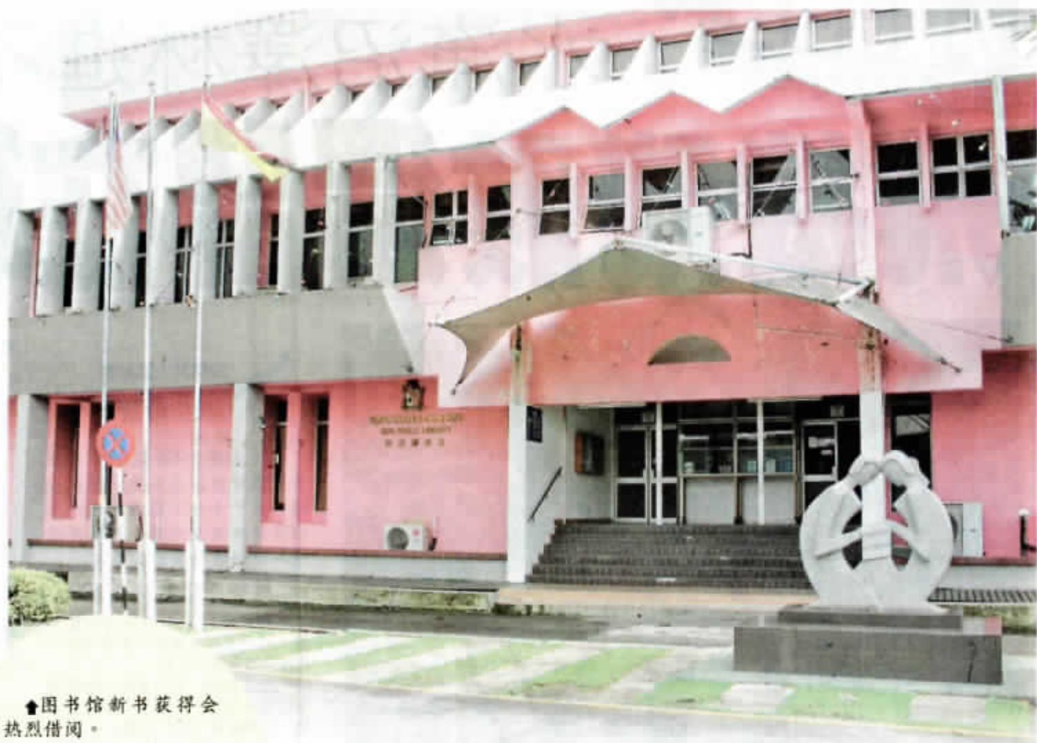
◆圖書館新書獲得會員熱烈借閱。